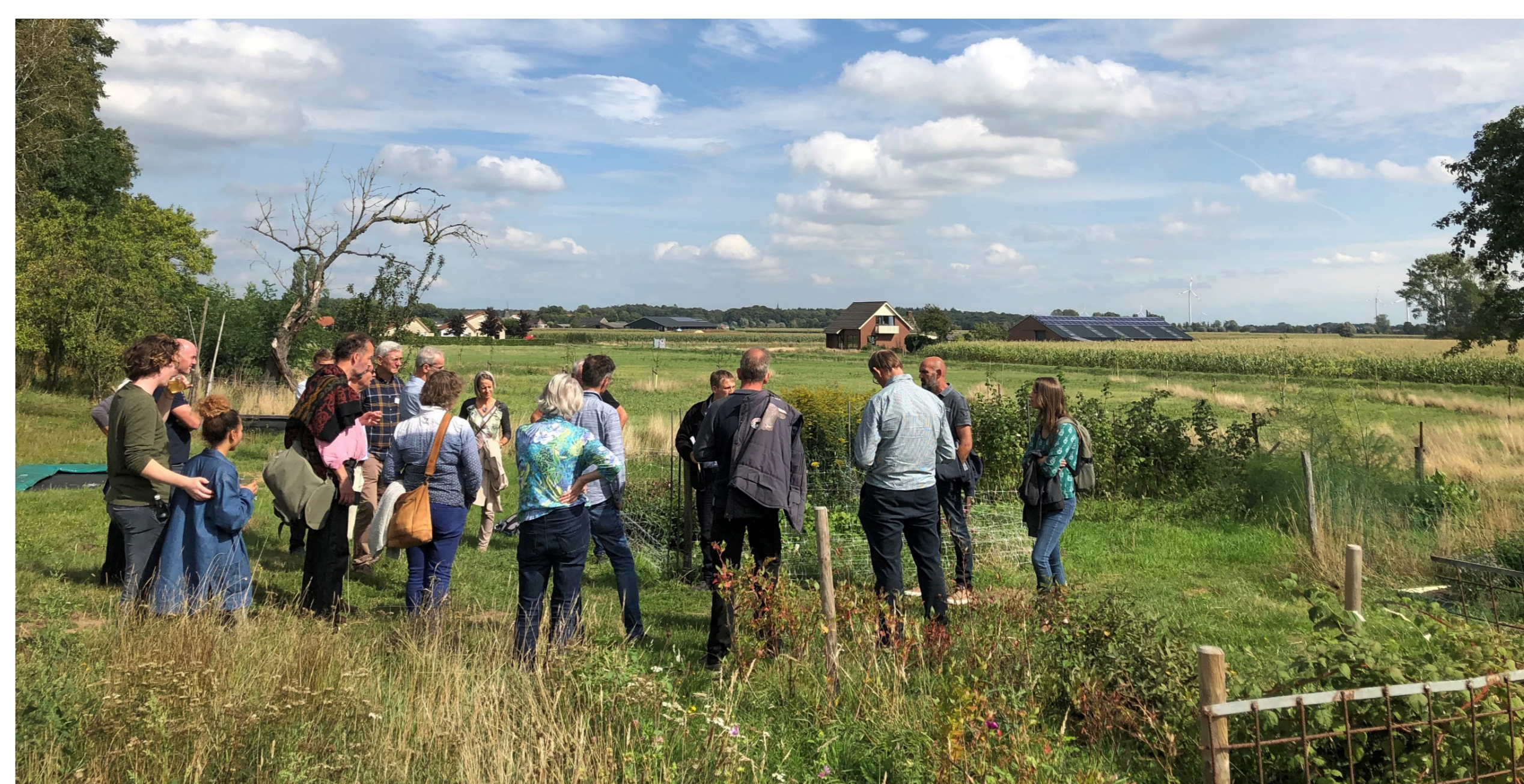
Figuur 3. Kick-off bijeenkomst Gelders Netwerk Agroforestry boerderij Wittenhorst, september 2020