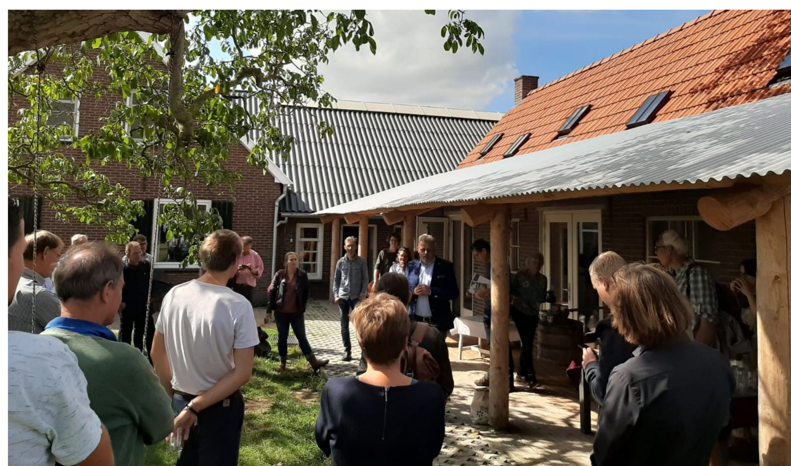
Figuur 2. Kick-off bijeenkomst Gelders Netwerk Agroforestry boerderij Wittenhorst, september 2020